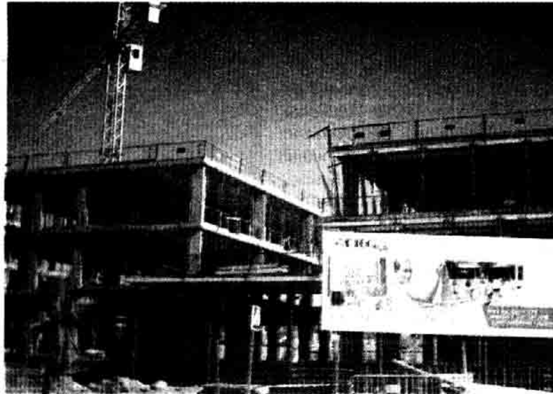
Imagen de la construcción del nuevo instituto en Paterna