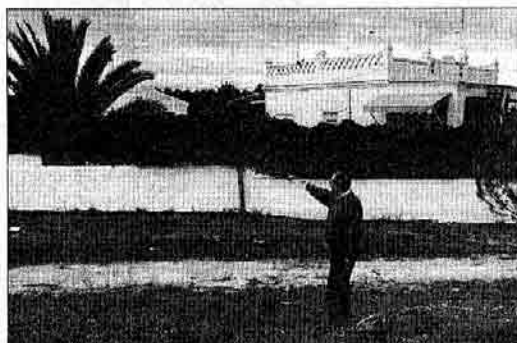
Un vecino señala la afécción en su chalé por las obras de La Canyada.

hacer chalés de lujo para millonarios». La extensión de La Vallesa permitiría levantar varias edificaciones de este tipo, «lo que podría suponer un negocio lucrativo para los propietarios».